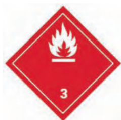
图 2 《联合国规章范本》中易燃液体的象形图

5.1.4.2.2 对于运输,应当使用规章范本规定的象形图(在运输条例中通常称为标签)。规章范本规定了运输象形图的规格,包括颜色、符号、尺寸、背景对比度、补充安全信息(如危险种类)和一般格式等。运输象形图的规定尺寸至少为 100 mm×100 mm,但非常小的包装和高压气瓶可以例外,使用较小的象形图。运输象形图包括标签上半部的符号。规章范本要求将运输象形图印刷或附在背景有色差的包装上。以下例子是按照规章范本制作的典型标签,用来标识易燃液体危险,见图 2。