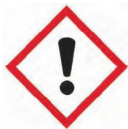
图 3 皮肤刺激物象形图