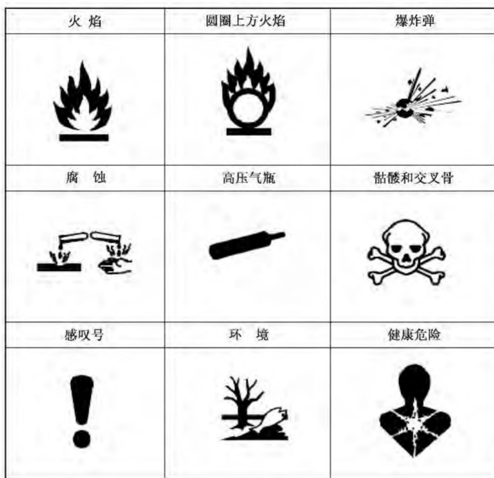
图 1 GHS 中应当使用的标准符号